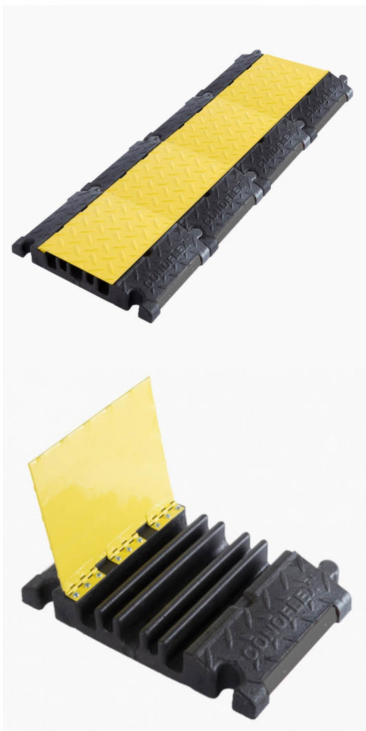
PRODUCTOS FABRICADOS CON FILTRO UV 8.000 HS. (27 MESES)